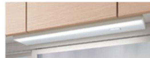
LED照明 (システムキッチン用)