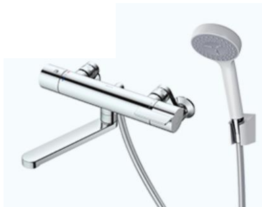
浴室シャワー節湯水栓