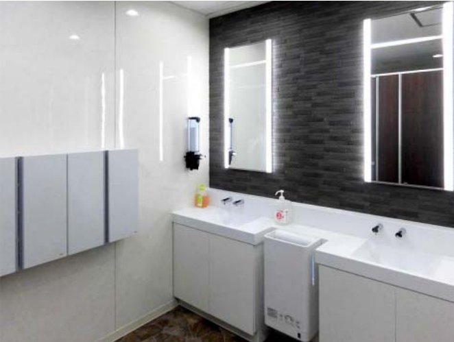
ユニバーサル製缶 滋賀工場

企業価値を向上させるためには「働く従業員満足（ES）の向上が必要」という視点から、近年、職場環境整備が進められる傾向があります。TOTOでは2018年9～10月に関西エリアの工場をもつ民間企業25社に、ESの取り組みに関するアンケート調査を実施しました。セミナーでは、その結果をご報告します。