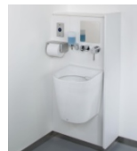
小規模施設やリモデルに対応しやすい コンパクトオストメイトバック