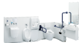
用途で選べる豊富なバリエーション コンパクト多機能トイレバック