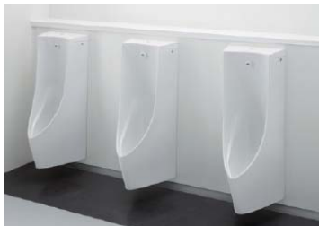
機能的でシンプルなデザイン 自動洗浄小便器