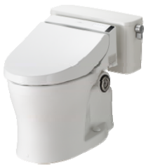
新洗浄システムで節水！ フラッシュタンク式大便器