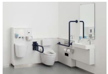
さまざまな利用者に対応 コンパクト多機能トイレパック