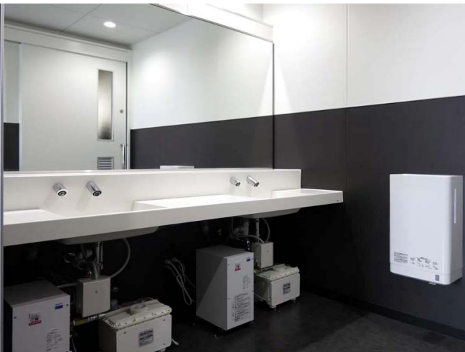
三菱自動車工業株式会社 岡崎本館

最新現場事例、利用者の声、最適な水まわり商品など、工場トイレに関する情報を広くお伝えするセミナーです。