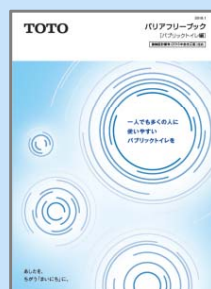
バリアフリーブック パブリックトイレ編

さまざまな身体状況の方々に配慮した水まわりのプラン、必要寸法、プランニングの考え方を掲載しています。