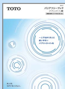
バリアフリーブック パブリックトイレ編

さまざまな身体状況の方々に配慮した水まわりのプラン、必要寸法、プランニングの考え方を掲載しています。