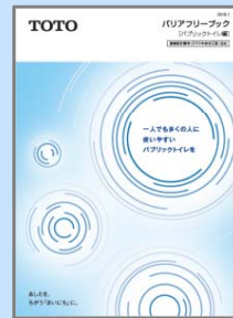
バリアフリーブック パブリックトイレ編

さまざまな身体状況 の方々へ配慮した 水まわりのプラン、 必要寸法、プラン ニングの考え方を掲載 しています。