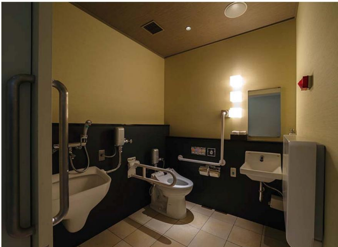
集いの館 多機能トイレ

車いす使用者やオストメイト、小さなお子様連れなどさまざまな使用者を想定して、汚物流しやベビーシートを完備している。