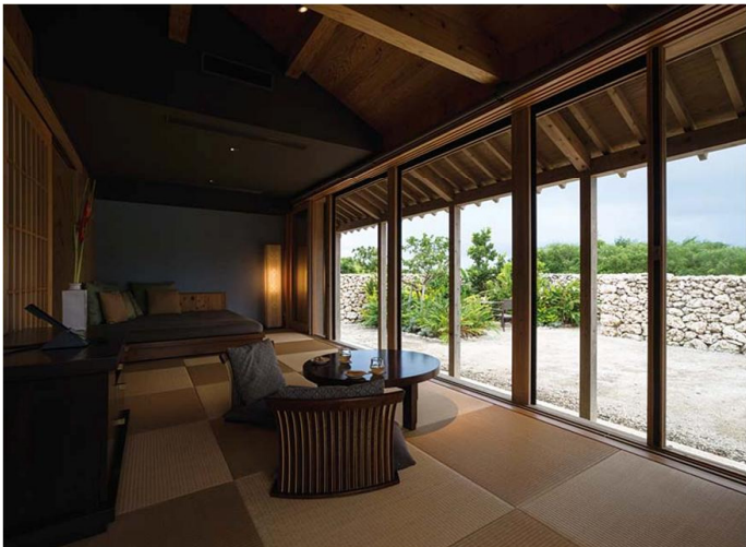
客室（「キャンギ」タイプ）

「キャンギ」タイプの客室は、リビングから寝室まで敷き詰めた琉球畳が特徴。広縁に置かれたソファに座って、庭を眺めながらのんびりした時間を過ごすことができる。