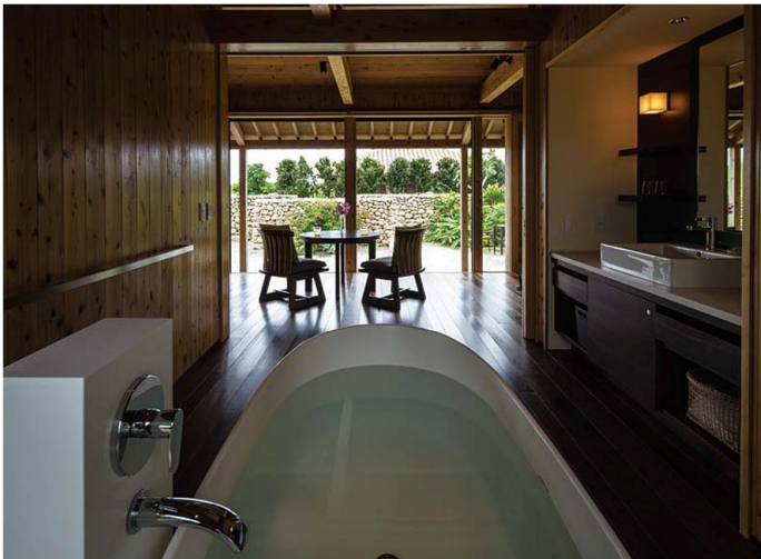
客室（「ガジョーニ」タイプ）

客室の縁側はすべて南向きで、心地よい風がリビングを通り抜ける。「ガジョーニ」タイプの客室は、部屋の中央に置かれたバスタブが特色。庭を眺めながら開放感あふれる贅沢な入浴を楽しむことができる。