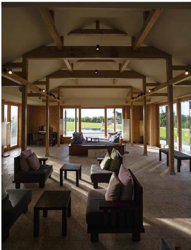
集いの館 ゆんたくラウンジ

「ゆんたくラウンジ」は、本やCD、新聞の貸し出しのほか、インターネットブースやドリンクコーナーを備えた、宿泊者の共有スペース。