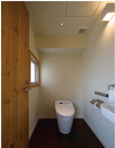
客室（「ガジョーニ」タイプ） トイレ

友達同士のお客様も想定し、浴室とトイレは別々に設置している。大便器は機能性とデザイン性に優れたネオレストを採用。