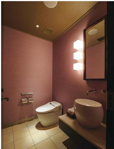
集いの館 女性トイレ

優美な印象のトイレ空間に、おしゃれな手洗いコーナーを設置。個室完結型のトイレを、男女別に設置している。