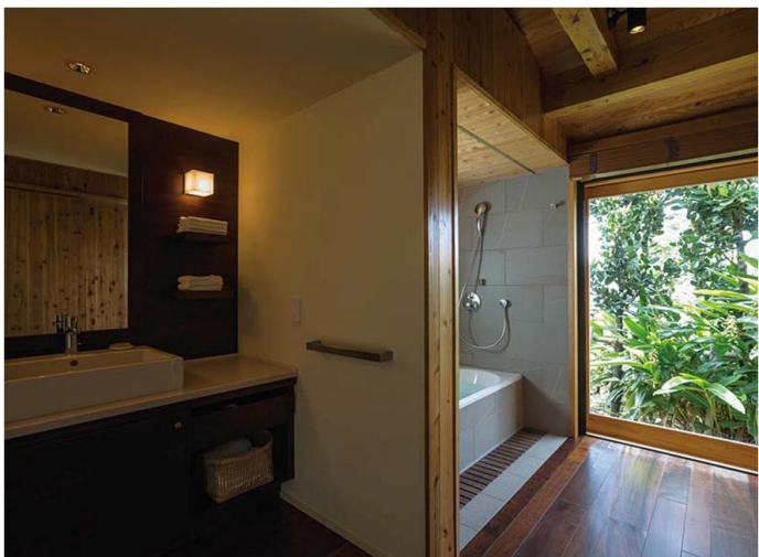
客室（「キャンギ」タイプ） 水まわり

ゆったりとしたリビングとウォークインクローゼットを確保するため、水まわりは、上質な空間にマッチさせながら、コンパクトに収めている。