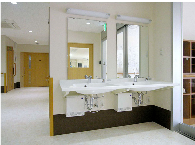
1F 玄関ホール 洗面コーナー

玄関横には洗面カウンターを設置。車いす使用者にも使いやすい、ポウルー体タイプの薄型洗面カウンターを採用。