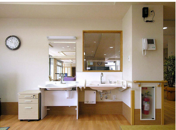
2F 食堂 洗面カウンター

車いす使用者が使いやすい洗面カウンター(左)と、自立歩行の方にも配慮し、手すりを備えた洗面カウンター(右)を設置している。