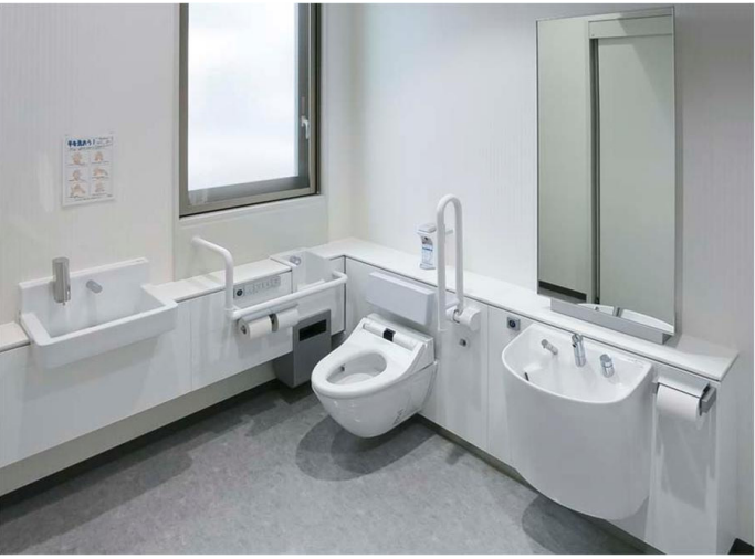
1F来客用 多機能トイレ

さまざまな来客者をお迎えするため、車いす使用者やオストメイトの方に配慮し、デザイン性と機能性を兼ね備えたRESTROOM ITEM01のフラットカウンター・多目的トイレバックを採用。