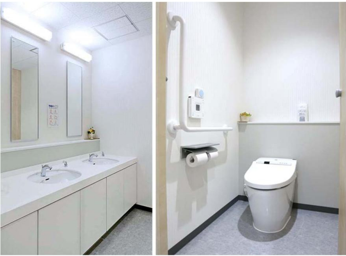
2F従業員用 女性トイレ

洗面コーナーは男性トイレ同様、感染対策として自動水栓と水石けん入れを設置。大便器は、すっきりとした空間を創出するウォシュレット一体型便器ネオレストを採用。手すりを設置している。