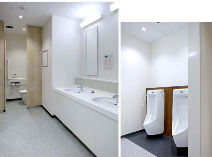
2F従業員用 男性トイレ

感染対策として、洗面コーナーにはノンタッチで手洗いができる自動水栓と水石けん入れを設置。小便器は床の清掃性に優れた、低リップタイプの壁掛式小便器を採用。