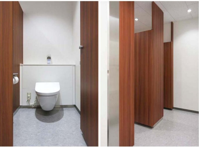
1F来客用 男性トイレ

大便器ブースはゆとりあるスペースを確保。大便器は、シンプルで上質なデザインと清掃のしやすさ、さらに先進のエコ機能を搭載したRESTROOM ITEM01の壁掛フチなしトルネード大便器を採用。