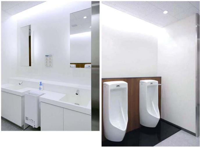
1F来客用 男性トイレ

天井が高くゆとりのある空間。小便器は床の清掃性に優れた壁掛式を採用し、荷物配慮としてフックを取り付けている。