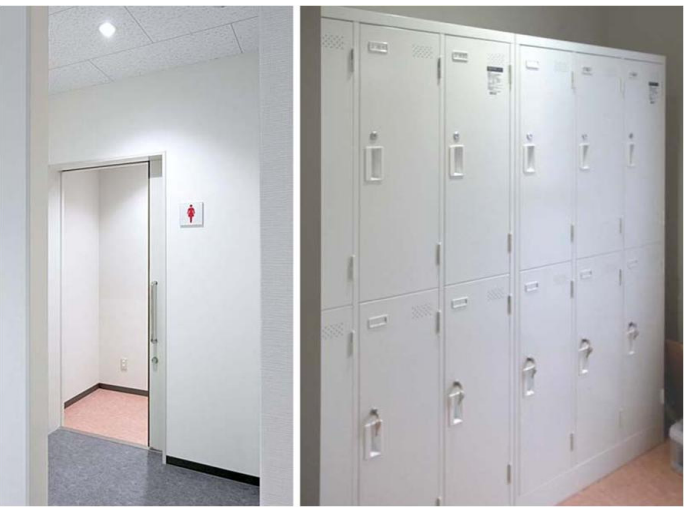
2F従業員用 女性トイレ

女性トイレの中にロッカー室を設置。勤務に向かう準備など、女性ワーカーのためのプライベート空間を集約している。