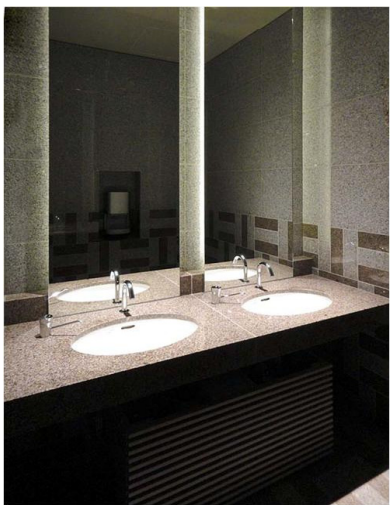
女性トイレ 洗面コーナー

洗面カウンターに天然石を使用して上質な高級感を演出。化粧鏡裏の間接照明が、シックで落ち着いた雰囲気演出している。