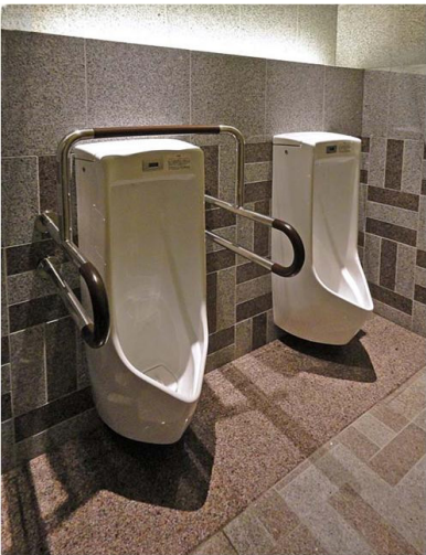
男性トイレ 小便器コーナー

小便器は床の清掃性に優れた壁掛式低リップタイプを採用。ライニング上の間接照明が、落ち着いた雰囲気を演出している。