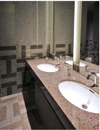
男性トイレ 洗面コーナー

空間をトータルにコーディネートした色調。衛生面に配慮して、ノンタッチで手洗いができる自動水栓を設置している。